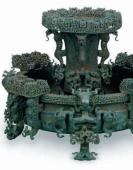
曾侯乙尊盘

曾侯乙尊盘由盘和置于盘中的尊两件器物而成。尊是盛酒器，盘是水器，冬季可盛沸水用于温酒，夏季可盛冰用于镇酒。全套器物通高42厘米，重近30公斤。尊体共装饰有28条龙、32条蟠螭，腹部和圈足满是蟠螭纹和浮雕的龙；盘体装饰56条龙、48条蟠螭，盘足为四条圆雕的双身龙，龙首、龙体、龙尾蜿蜒曲折，表现出充沛的生命力。