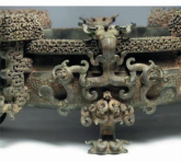
曾侯乙尊盘的盘口沿龙形

觥的前端为昂首龙头，瞪目张口，齜牙咧嘴。器盖正中有菌状的钮。腹部前窄后宽，两侧两个方形系，穿上绳子可将器物提起。觥上还有蛇、鳄鱼等为主的大小纹饰20多条。它们相互