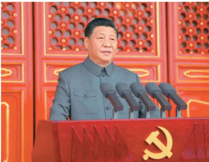
7月1日，庆祝中国共产党成立100周年大会在北京天安门广场隆重举行。中共中央总书记、国家主席、中央军委主席习近平发表重要讲话。