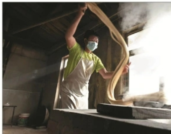
农历腊月二十三,被人们称之为小年。这一天,一些地方有用麻糖祭祀的习俗。小年刚过,记者走进东洼村东洼村一探麻糖的制作。

米,属于饴糖类,由纯粮经过发酵而成,本质上与白砂糖、红砂糖及其制品完全不同,是真正的纯天然、无污染的甜味食品。其工艺流程主要有生麦芽、蒸米、醋化发酵、熬糖稀、手工拔糖、切糖、冷却、蒸湿、芝麻、成品。因其制作技术的传承需要,2020年9月,麻糖制作被列入入市级非物质文化遗产。